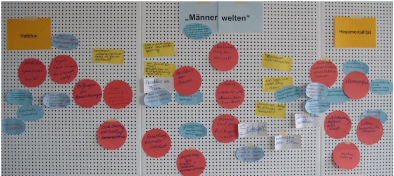
Vielschichtige Männlichkeiten. Eines der Arbeitsergebnisse des Blockseminars „Konstruktion von Männlichkeit in Geschichte und Gegenwart“.