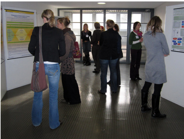
Auf dem Foto: Postersession der Jahrestagung