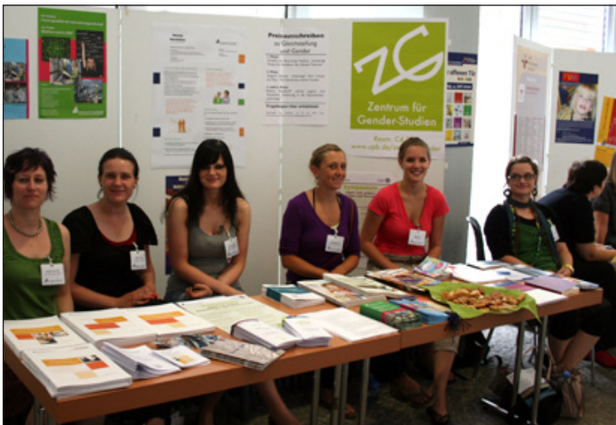
Tag der Offenen Tür, Universität Paderborn, 04.07.10

Am 04. Juli 2010 hat das Zentrum für Geschlechterstudien / Gender-Studies an einem gemeinsamen Stand mit der Gleichstellungsbeauftragten und dem Projekt „Frauen gestalten die Informationsgesellschaft“ bei sommerlichen Temperaturen die geschätzten 10.000 Besucher des Tages der Offenen Tür der Universität Paderborn über seine Arbeit und Veranstaltungen informiert. Am Mittag fand in den Räumen des Zentrums für Geschlechterstudien / Gender-Studies zudem die Eröffnung der Fotoausstellung zur Krise der Männlichkeit statt.