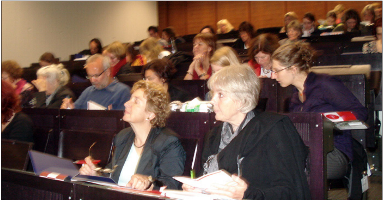
TeilnehmerInnen und ReferentenInnen des Symposiums