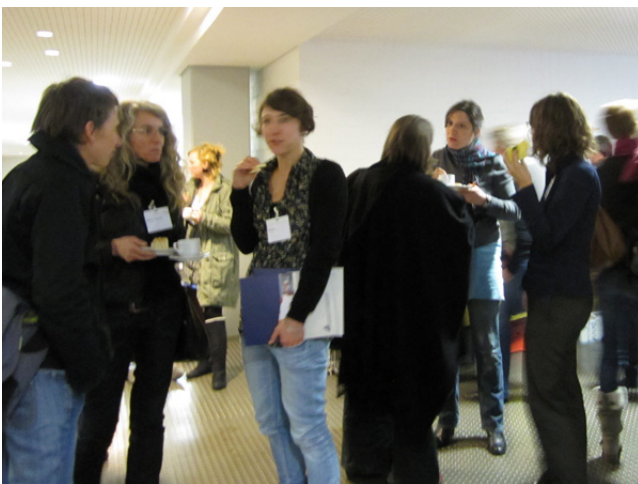
Auf dem Foto: Diskussionen während der Tagung